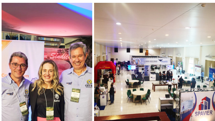
CRT-SP no Café com Síndico: divulgação de serviços e palestra institucional para síndicos e administradores de condomínios