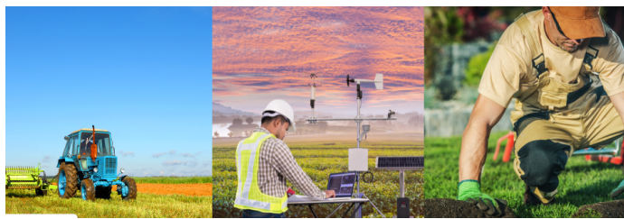
Técnicos em Agroindústria, Meteorologia e Paisagismo: confira as atribuições profissionais e campos de atuação de cada modalidade