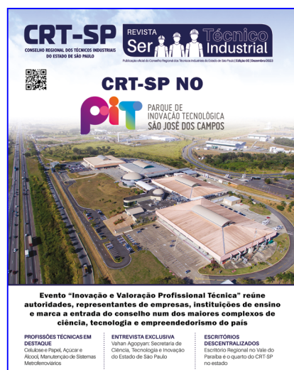
Revista Ser Técnico Industrial [Edição 05 – Dezembro/2023]: disponível para consulta, download e compartilhamento