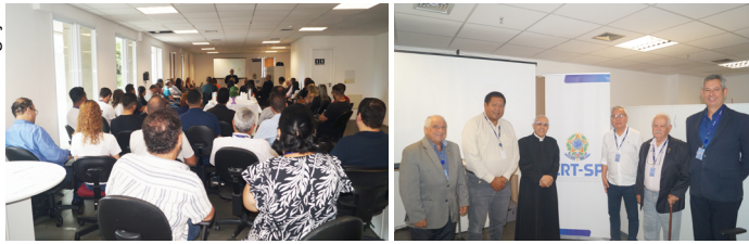
Sob a proteção divina: conselho e funcionários são abençoados com orações e palavras impactantes e inspiradoras

No dia 9 de janeiro de 2024, aconteceu um ato ecumênico de bênçãos e agradecimentos pelos cinco anos de fundação do CRT-SP, contados a partir da eleição da