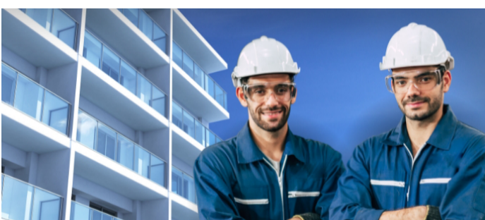
Oportunidades para técnicos em condomínios aumentam na mesma proporção em que as cidades se verticalizam

De acordo com uma pesquisa do G1, a cidade de São Paulo deve bater um recorde imobiliário histórico em 2024, com a entrega de mais de 800 condomínios – quase o dobro do ano passado –, sendo 98% para residências e 2% para fins comerciais. De olho nesse mercado de trabalho altamente dinâmico e promissor estão os profissionais técnicos com atribuições legais, conforme suas respectivas modalidades, para executar a maioria dos serviços de reforma e manutenção em condomínios residenciais e comerciais, com qualidade, responsabilidade e economia para os condôminos.