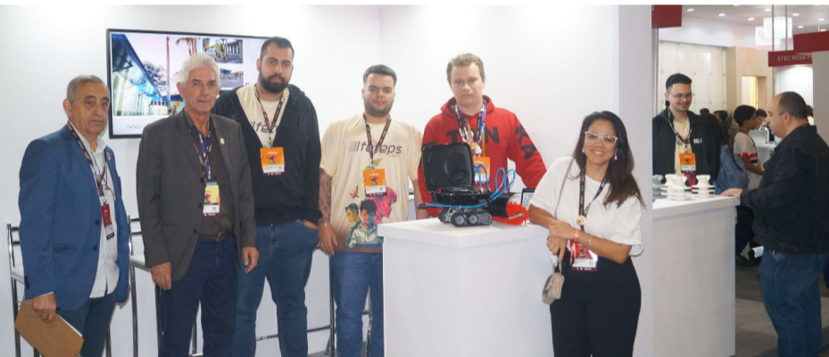
CRT-SP presente numa das mais importantes feiras de projetos técnicos e científicos do país

No período de 19 a 22 de agosto de 2024, o CRT-SP esteve presente na 15ª Feira Tecnológica do Centro Paula Souza (FETEPS), com um grupo formado por funcionários e integrantes da Comissão de Educação e Atribuições Profissionais avaliando e selecionando os projetos de cunho