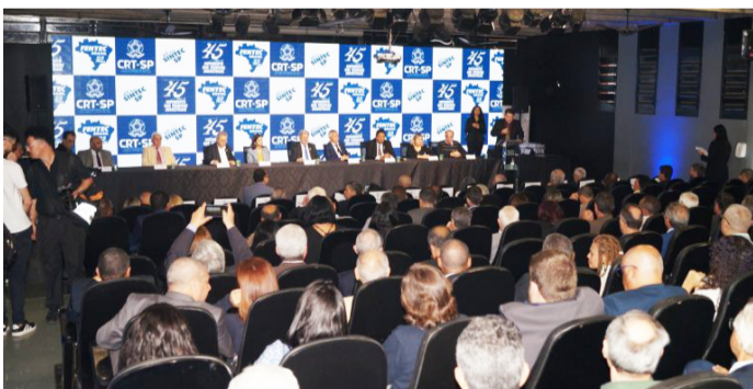
De 1979 a 2024: um movimento construído com força, determinação e garra de líderes que continuam trabalhando pelos técnicos e a sociedade